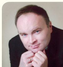
WŁODZIMIERZ SIEDLIK / POLSKA / POLAND

Absolwent Akademii Muzycznej w Krakowie, Instytutu Liturgicznego Papieskiej Akademii Teologicznej w Krakowie (dyplom z wyróżnieniem) oraz Studium Emisji Głosu Akademii Muzycznej w Bydgoszczy (dyplom z wyróżnieniem). W marcu 1990 został laureatem Ogólnopolskiego Konkursu Dyrygentów Chórów w Poznaniu. W latach 1990–1992 był dyrektorem Centrum Paderewskiego w Tarnowie. W 1991 założył Tarnowską Orkiestrę Kameralną. W latach 1992–1996 był dyrektorem Zespołu Państwowych Szkół Muzycznych w Tarnowie. Od 1994 pracuje na stanowisku adiunkta w Instytucie Liturgicznym PAT w Krakowie (obecnie UPJPII). Podczas swojej pracy dyrygenckiej z chórami Cantus, Psalmodia oraz Chórem Męskim UJ uzyskał wiele nagród i wyróżnień polskich i zagranicznych. W latach 1995–2010 pełnił funkcję Dyrektora i Kierownika Artystycznego Chóru Polskiego Radia w Krakowie. W 2010 roku został odznaczony medalem „Zasłużony dla Kultury Polskiej” nadawanym przez Ministra Kultury i Dziedzictwa Narodowego. W 2012 uzyskał stopień doktora habilitowanego w Akademii Muzycznej w Krakowie, gdzie pełni funkcję kierownika Katedry Chóralistyki. W tym samym roku został uhonorowany odznaczeniem „Benemerenti” przez Papieża Benedykta XVI za wyjątkowe zasługi dla Kościoła. W 2013 otrzymał medal „Plus ratio quam vis” nadany przez prof. Wojciecha Nowaka, Rektora Uniwersytetu Jagiellońskiego.